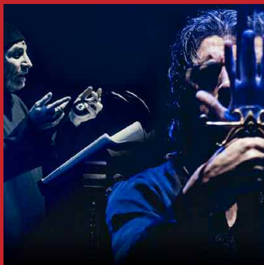
EL CABALLERO Y LA MUERTE