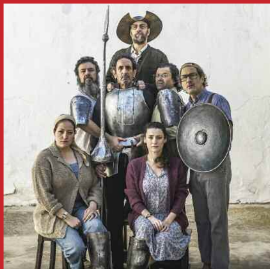
DON QUIJOTE SOMOS TODOS