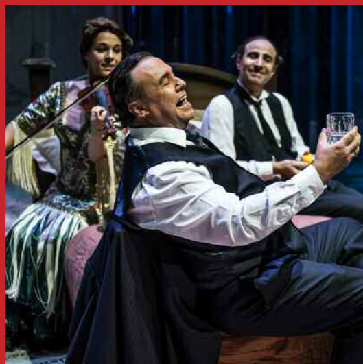
LOS HERMANOS MACHADO