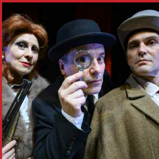
LOS CRÍMENES DE LA CALLE MORGUE