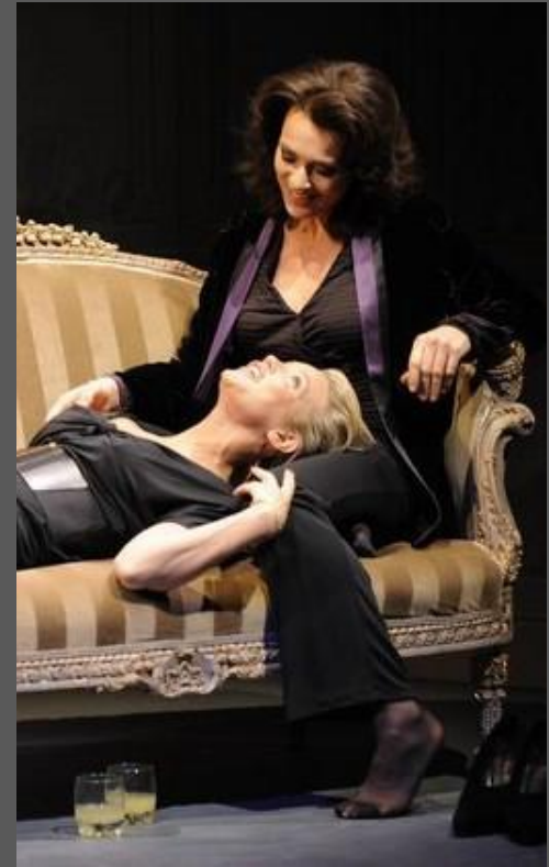
Teatro Marigny de París-Popesco