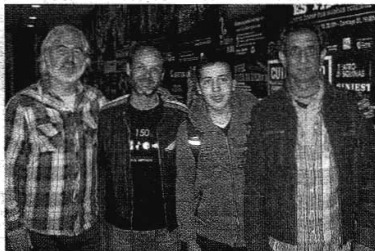
ALUMNOS, PROFESORES Y ACTORES SE SALUDARON TRAS LA FUNCIÓN.

ba mil vueltas al original -que nos había resultado en clase un poco aburrido-, pues conseguía captar mejor nuestra atención que el texto en prosa, sobre todo al utilizar expresiones de nuestra época, expresiones, que de un modo u otro, se nota que eso influye en nuestra atención. Por ejemplo, cuando hablan de la crisis actual, sobre el vestuario que ellos mismos utilizan en la obra, o cuando simplemente comentan que el español ha cambiado mucho desde esos tiempos... «Lol».